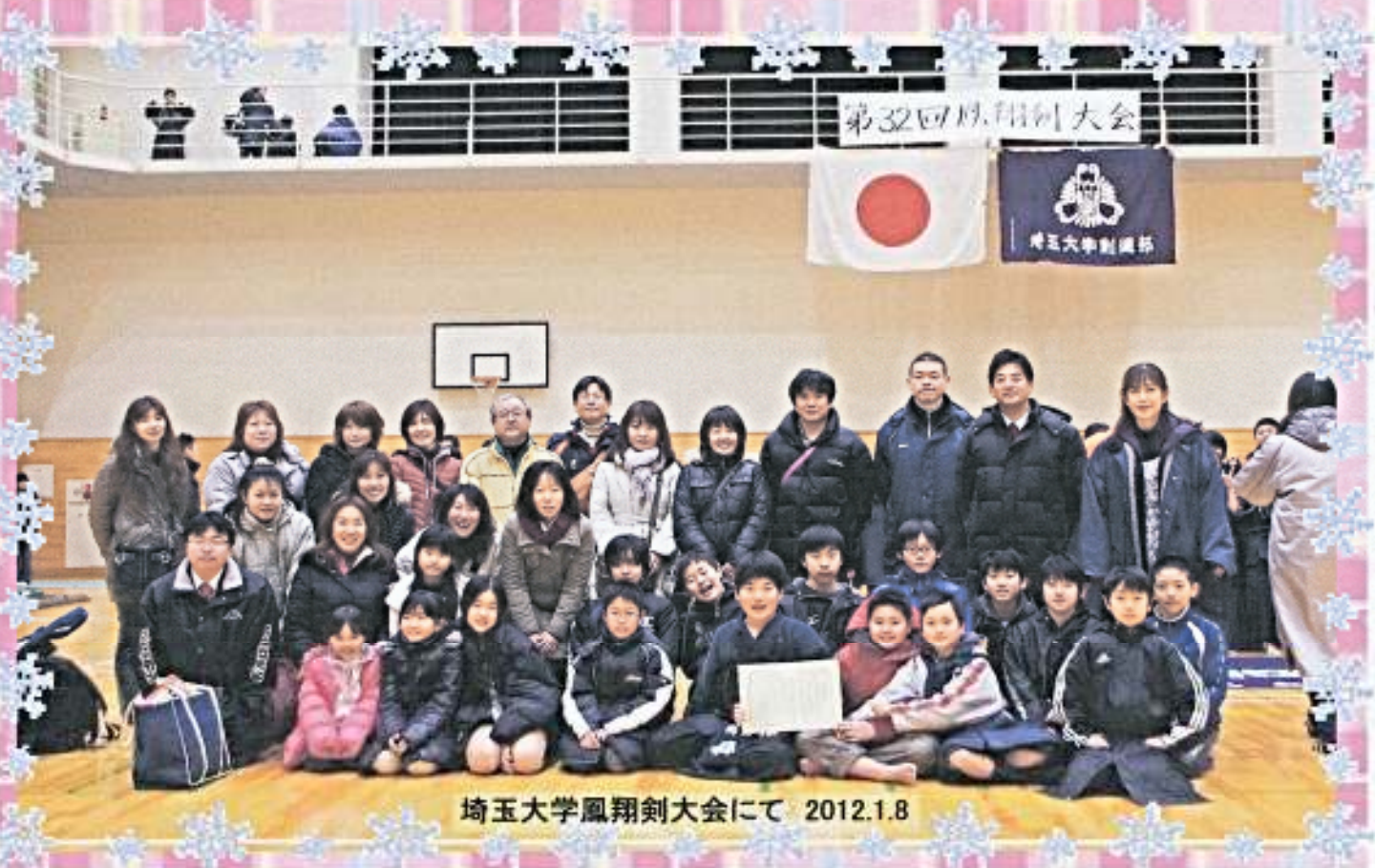
埼玉大学鳳翔剣大会にて 2012.1.8