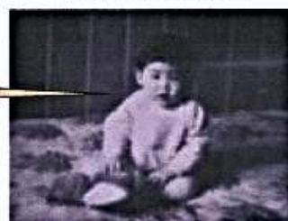
生後間もない本人